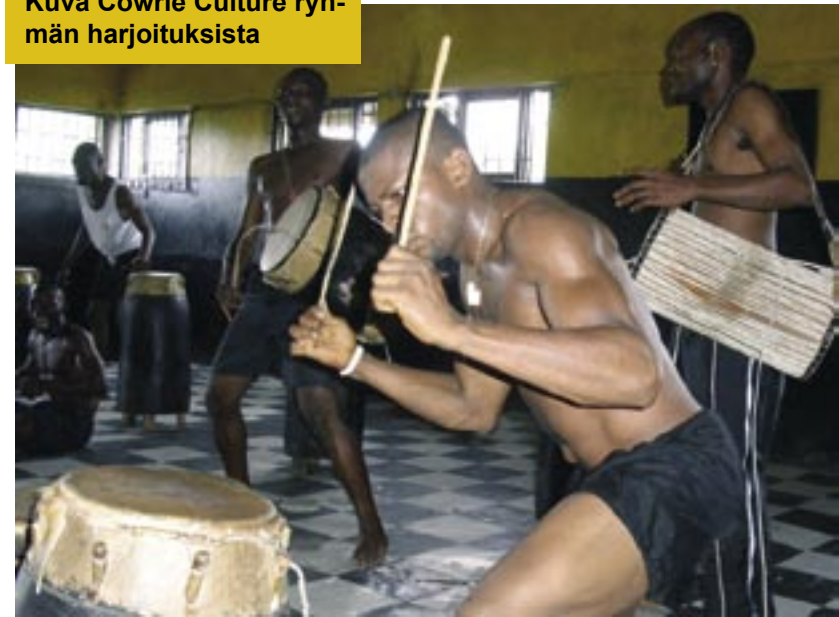
Kuva Cowrie Culture ryhmän harjoituksista

Kuri luokissa oli hyvä, vaikka siellä saattoi istua lähes 100 lasta yhdessä luokassa. Kaikilla oli puhtaat kouluasut päällä, pojilla valkoiset paidat ja mustat housut, tytöillä valkoiset hameet ja puserot. Opettajilla oli myös jokaisella oma bamburuokokartta-keppi kainalossa. Osoitin oman tietämättömyyteni ja jopa tyhmyyteni kysyessäni, oliko keppi myös oppilaiden rankaisua ajatellen tarpeen. Sain vastaukseksi, että lyöminen on kiellettyä ja kepillä on vain helpompi osoittaa.