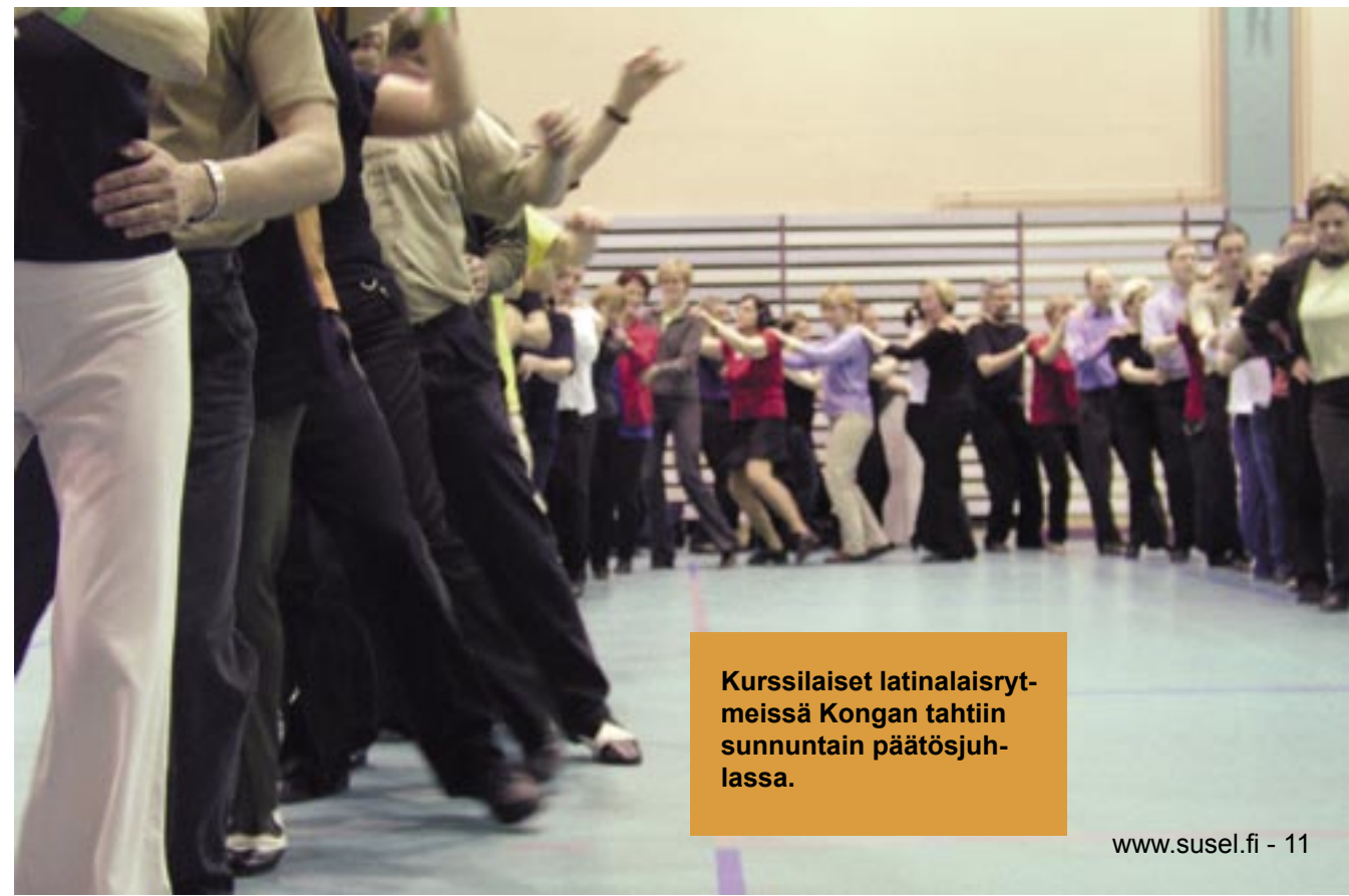
Kurssilaiset latinalaisrytmeissä Kongan tahtiin sunnuntain päätösjuhlassa.