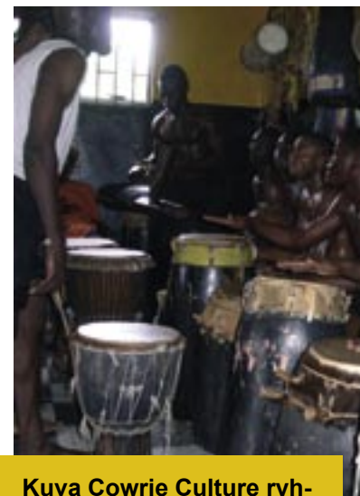
Kuva Cowrie Culture ryhmän harjoituksista

Monet ennakkokäsitykset taas mureniivat, kun kollegat kirjoittelivat liidulla taululle samoja juttuja englannin kieliopista mitä meilläkin ja kuvaamataito, fysiikka ja kemia sekä liikunta ovat siellä samantyyppisiä opetussuunnitelmien suhteen meidän kanssamme.