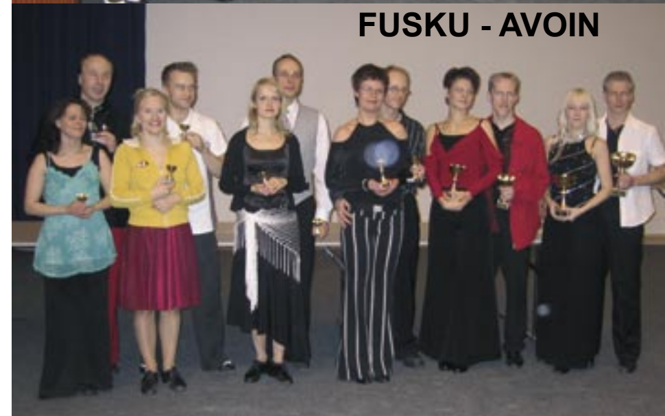
FUSKU - AVOIN